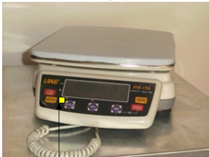
Ovjerni žig u obliku naljepnice